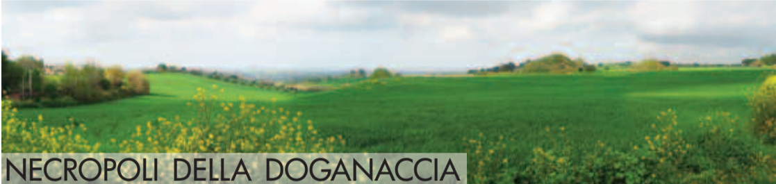
NECROPOLI DELLA DOGANACCIA

Ai grandi tumuli va riconosciuto un ruolo emblematico dello splendore aristocratico e del controllo che esercitavano sul territorio le famiglie gentilizie, che basavano la loro ricchezza sulla proprietà della terra e sullo sfruttamento delle risorse naturali, nonché sul controllo degli scambi. E’ probabile che all’interno delle famiglie sepolte nei grandi tumuli, come avveniva nel mondo greco-omerico, emergessero i re o “lucumoni” al vertice della comunità locale.