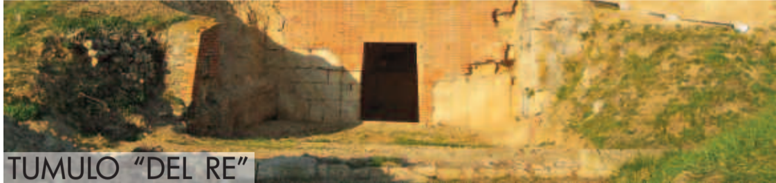
TUMULO “DEL RE”

Il modello architettonico tarquiniese si ispira a una tipologia di tombe reali dell’VIII-VII secolo a.C. conosciuta nella Cipro di cultura omerica. Nella necropoli di Salamina, nel sud-est dell’isola, sono infatti presenti sepolture con ricchissimi corredi confrontabili con quelle di Tarquinia, per la presenza del tumulo, del grande ingresso e delle murature in blocchi squadrati. E’ probabile che all’origine di questo modello ci siano proprio architetti di formazione orientale, supportati da squadre di operai specializzati nel taglio delle pietre, arrivati a Tarquinia all’inizio del VII secolo a.C., che qui avrebbero introdotto innovativi schemi architettonici per l’aristocrazia locale.