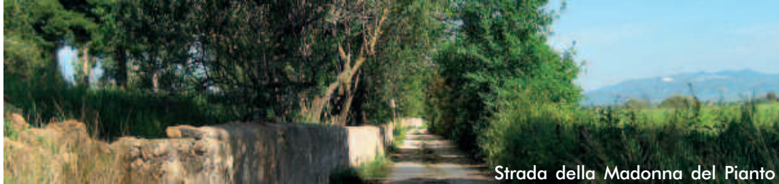
Strada della Madonna del Pianto

La tipologia del tumulo Luzi è caratteristica dell’architettura funeraria tarquiniese: un ambiente ipogeo, interamente scavato nella roccia, a pianta rettangolare allungata, con pareti a profilo ogivale e un’ampia fenditura longitudinale nel soffitto sigillata da lastroni. Addossata alla parete di fondo c’è una bassa banchina sulla quale era forse deposto parte del corredo del defunto. La camera è preceduta da un vestibolo monumentale a cielo aperto caratterizzato da una scalinata centrale e tre rampe minori laterali, una sorta di cavea destinata ad accogliere gli spettatori familiari e altri notabili in occasione delle cerimonie funebri che possiamo immaginare accompagnate da recite, canti, musiche e giochi, e che si svolgevano nel “piazzaleto” davanti all’ingresso della camera sepolcrale. Nel pavimento del “piazzaleto” si segnala inoltre la presenza di una fossa rettangolare utilizzata per i riti funebri, che conteneva resti di ossa animali e oggetti votivi. La tomba, vista la sua monumentalità, accoglieva senz’altro le spoglie di un “principe” appartenente alla ricca e potente classe aristocratica tarquiniese del VII secolo a.C. Il corredo funerario rinvenuto nella tomba è purtroppo molto frammentario a causa dell’intrusione di scavatori clandestini; al momento della scoperta la camera era colma di terra fino alla volta.