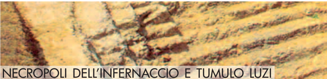
NECROPOLI DELL’INFERNACCIO E TUMULO LUZI

La tomba principesca, rivolta a ovest come il tumulo “del Re”, è preceduta da un grande ingresso a cielo aperto (“piazzaleto”, largo 5,7 m e profondo circa 7,5) delimitato su tre lati da spessi paramenti in blocchi di calcare ben connessi fra loro; questo spazio introduceva alla cella funeraria, collocata verso il centro del tumulo. Il “piazzaleto” è semi-costruito e contraddistinto da una larga scalinata scavata nella roccia che scende verso la camera funeraria, davanti alla quale si svolgevano riti e spettacoli in onore del defunto. Sul lato destro del piazzale, dove il paramento è meglio conservato, sono presenti, nella parte alta, blocchi disposti a formare una cornice aggettante, mentre le tracce di intonaco bianco su alcuni tratti dei muri indicano la presenza di un rivestimento originario a protezione dell’ambiente all’aperto.