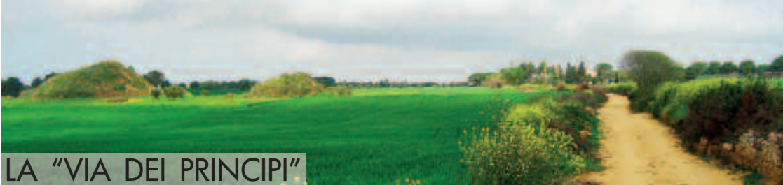
LA “VIA DEI PRINCIPI”

Sulla collina compresa fra la città antica (la Civita) e il mare, sorge la vasta necropoli etrusca dei Monterozzi, così chiamata per la presenza in superficie - secondo un uso derivato dal mondo orientale - di “tumuli” funerari. Su questo rilievo dominante, accanto alle più antiche incinerazioni villanoviane del IX-VIII secolo a.C., si trovano le celebri tombe affrescate costituite da camere scavate nella roccia e segnalate in superficie da tumuli di terra. Meno conosciuti sono invece i più antichi e grandiosi tumuli aristocratici che cingevano a corona l’altipiano della città.