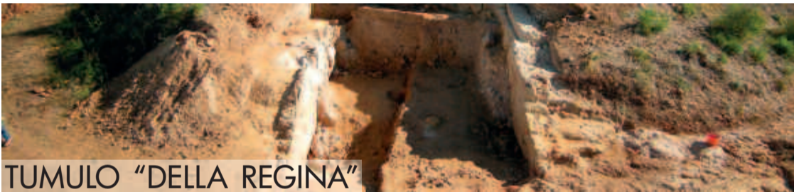
TUMULO “DELLA REGINA”

Significativa è la posizione dei monumenti: le due tombe sono state infatti costruite in un luogo particolarmente esposto, in modo da esaltare i caratteri colossali dei sepolcri. Peraltro, la disposizione a coppia dei tumuli, situazione poco diffusa in Etruria, suggerisce l’appartenenza dei sepolcri a membri della stessa famiglia aristocratica. Si tratterebbe di monumenti fatti erigere da fratelli o cugini nel giro di una generazione circa. Il potere economico di questa famiglia si basava probabilmente sullo sfruttamento della fertile piana costiera, e sul controllo dei traffici fra la città e lo scalo marittimo di Tarquinia. I tumuli della Doganaccia si posizionano difatti lungo uno dei più antichi itinerari diretti al mare, in corrispondenza di un remoto accesso alla necropoli dei Monterozzi. La strada proveniente dalla costa ricalcava l’ampio canalone che separa i due terrazzi calcarei occupati dai tumuli. Suggestiva e primeggiante era quindi la collocazione delle due tombe per chi giungeva dalla costa.