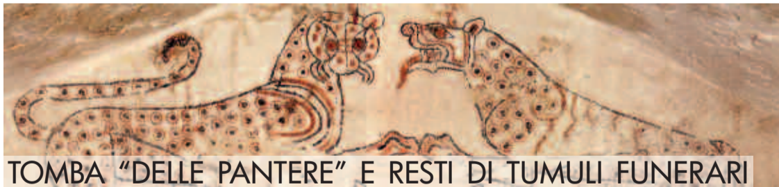
TOMBA “DELLE PANTERE” E RESTI DI TUMULI FUNERARI

Le due camere mostrano caratteri architettonici comuni: hanno una pianta rettangolare irregolare e copertura a falsa-ogiva (in parte distrutta) tipica delle tombe tarquiniesi di età orientalizzante. Ogni ambiente è munito di una coppia di banchine, di cui una, quella di sinistra della camera A, rievoca un letto ligneo per l’indicazione schematizzata della struttura portante, mentre in testata è scolpito, a bassorilievo, un cuscino semilunato. Entrambe le camere conservavano, fra le banchine, i resti dei corredi molto disturbati dalle profanazioni. La costruzione della tomba e le deposizioni risalgono alla seconda metà del VII secolo a.C. La tomba gemina della Doganaccia rappresenta una rarità architettonica di deposizioni principesche; l’esempio tarquiniese è uno dei più antichi sepolcri, se non addirittura il prototipo, del tipo gemino in Etruria.