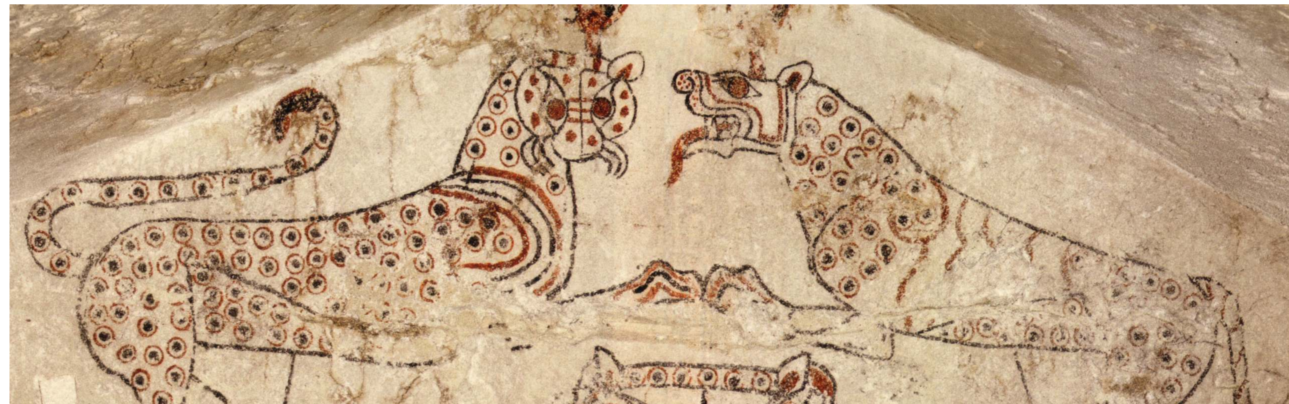
Particolare dell'affresco "delle Pantere"

Le tombe a camera, dal loro apparire a cavallo fra VIII e VII sec. a.C., erano contraddistinte in superficie da "tumuli" di terra di varie dimensioni. Nell'Ottocento, sulla collina dei Monterozzi, si contavano ancora circa 600 tumuli funerari; oggi sono quasi totalmente scomparsi perché spianati dalle arature che hanno risparmiato, come si può vedere in questa area archeologica, solo lo zoccolo di pietra che conteneva alla base il monte di terra. Questo settore di necropoli è interessante per la presenza di tumuli con crepidini realizzate con tecniche differenti: con pietre piccole e irregolari quasi a formare una sorta di massciata (tomba delle Pantere); con blocchi squadrati (tombe 6183 e 6184); con blocchi modanati (tomba 6188). Spesso a guardia del sepolcro, al suo ingresso, erano collocate sculture di pietra: belve e mostri minacciosi a rappresentare il misterioso mondo dei morti.